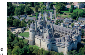
Vue aérienne du château

sa mort, son gendre Maurice Ouradou continue le chantier jusqu'en 1885 sans l'achever.