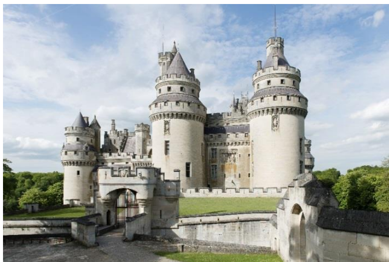
Façade sud-ouest, entrée du château de Pierrefonds

C'est en 1393 que Louis d'Orléans, fils cadet de Charles V, reçoit en apanage le duché de Valois. Prince bâtisseur et mécène, il ordonne aussitôt la construction d'une demeure fortifiée en lieu et place de la première forteresse des descendants de Nivelon de Pierrefonds. Bien qu'inachevée au moment de l'assassinat du duc d'Orléans par son cousin Jean sans Peur, duc de Bourgogne, Pierrefonds n'en demeure pas moins célèbre par ses dimensions spectaculaires, la qualité de son décor et la puissance de son système défensif. Le château