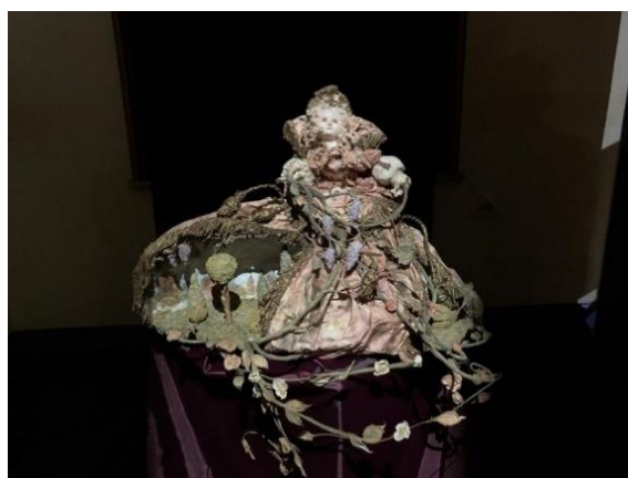
Laetitia Mieral, Jardin d'Armide © CMN