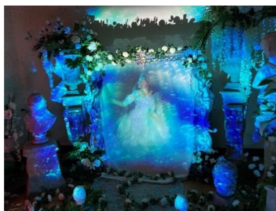
Jardin d'illusions