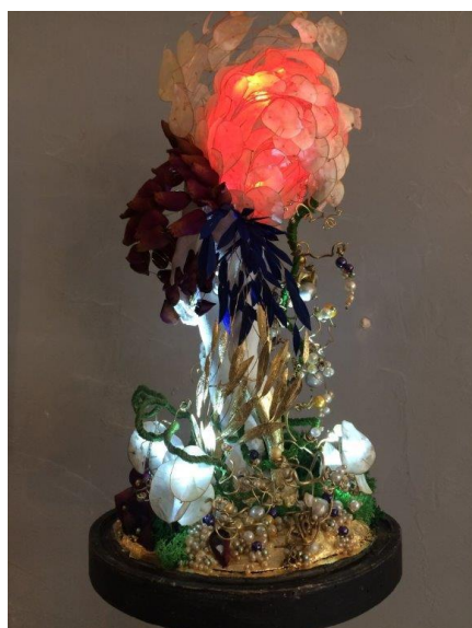
Sébastien Simon, Au cœur du jardin , 2022 © Sébastien Simon