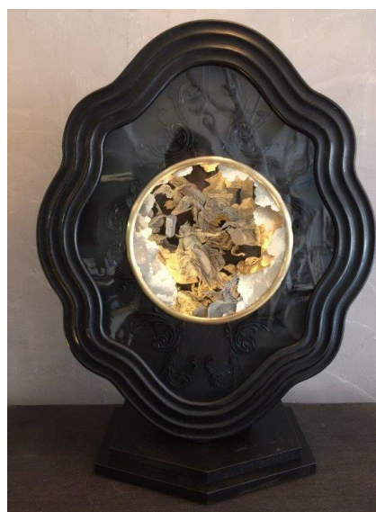
Sébastien Simon, La destruction du palais , 2022 © Sébastien Simon