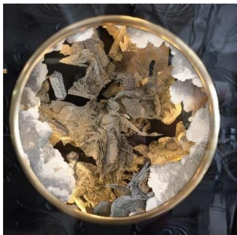
Sébastien Simon, La destruction du palais (détail) , 2022 © Sébastien Simon