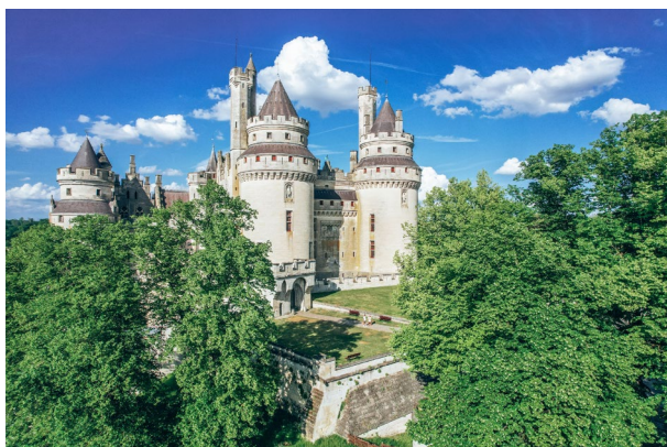
Façade sud-ouest, entrée du château de Pierrefonds

C'est en 1393 que Louis d'Orléans, fils cadet de Charles V, reçoit en apanage le duché de Valois. Prince bâtisseur et mécène, il ordonne aussitôt la construction d'une demeure fortifiée en lieu et place de la première forteresse des descendants de Nivelon de Pierrefonds. Bien qu'inachevée au moment de l'assassinat du duc d'Orléans par son cousin Jean sans Peur, duc de Bourgogne, Pierrefonds n'en demeure pas moins célèbre par ses dimensions spectaculaires, la qualité de son décor et la puissance de son système défensif.